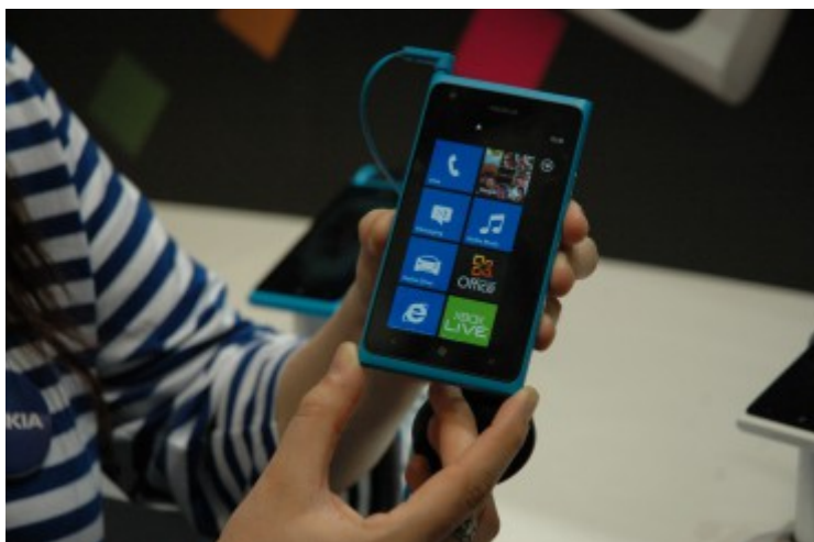
Le Lumia 900 LTE sous Windows Phone 7.5 de Nokia.