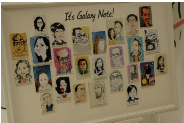
Le mur de croquis de visiteurs réalisés avec le Samsung Galaxy Notes.