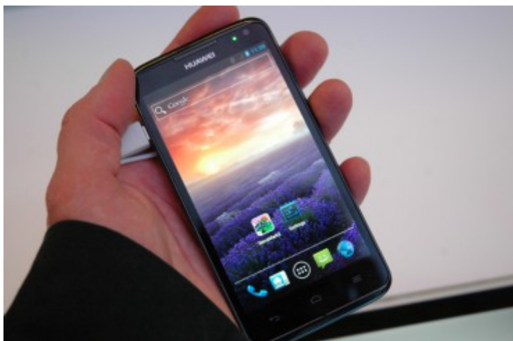
L'Ascend D quad, premier smartphone Android quadricœur chez Huawei.