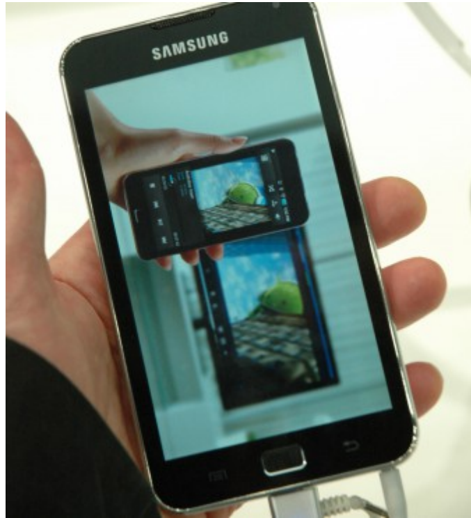
Mise en abyme à partir d'un Samsung Galaxy.