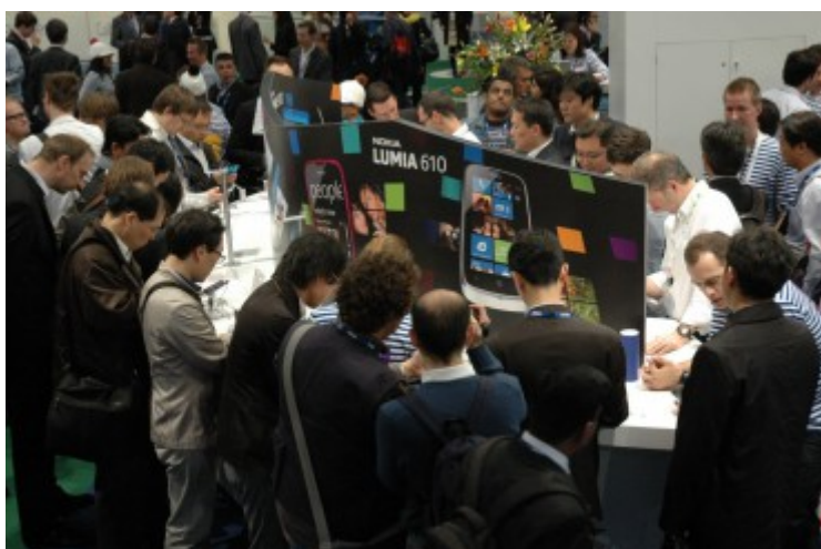
Affluence sur le stand de Nokia pour son retour au Mobile World Congress en tant qu'exposant.